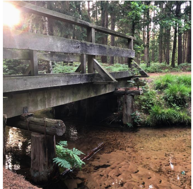
B. Gade © GemeindebriefDruckerei.de

Auf das Konto der Ev. Kirche in Hessen und Nassau DE71 5206 0410 0104 1000 00